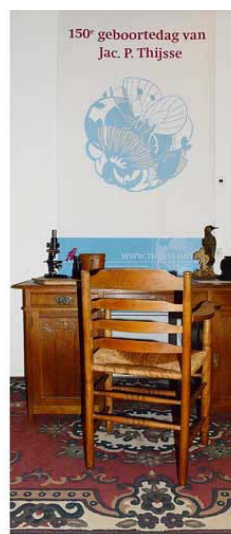
Bureau van Jac. P. Thijssse gefotografeerd op zijn 150° geboortedag 25 juli 2015 Thijssse's Hof Bloemendaal in het instructielokaal

25 juli 2015 / 12:20:07 Beeld van Jac. P. Thijssse in het Thijssse's Hof te Bloemendaal